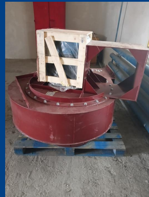
Дымосос с электродвигателем