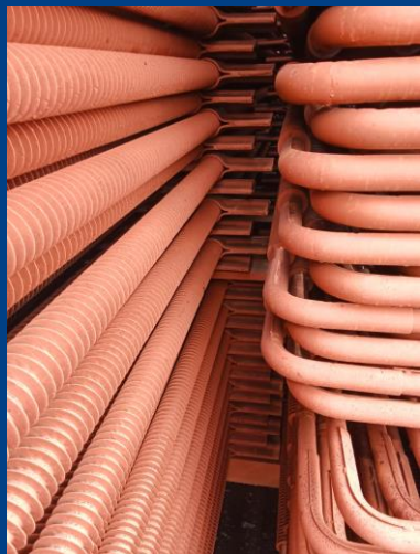
Пакеты змеевиков водяного экономайзера I и II ступени для к/а БКЗ-420-140