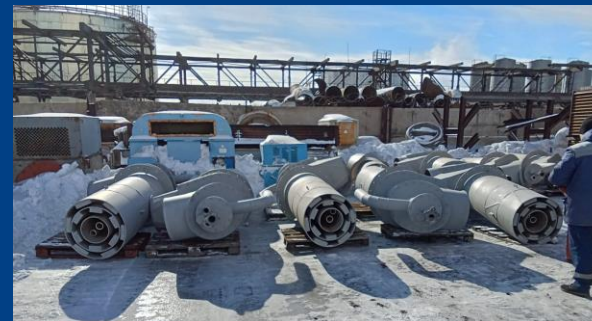
Горелки пылеугольные для к/а БКЗ-420-140 - 8 шт.