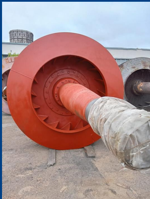
Ротор дымососа - 1 шт. (ДН-26)