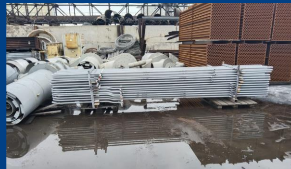
Пакеты ХПП для к/а БКЗ-420-140