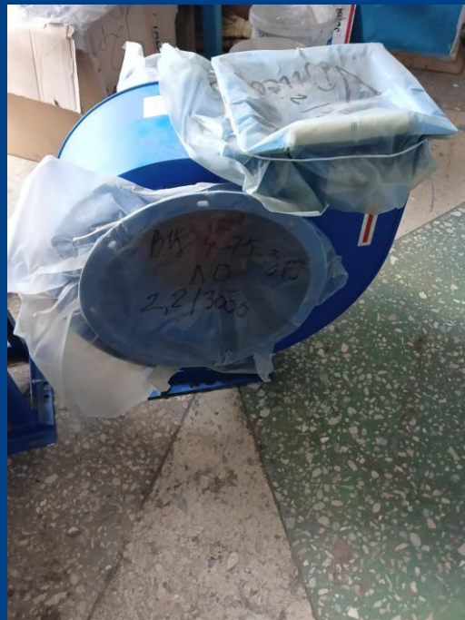
Дутьевой вентилятор с электродвигателем